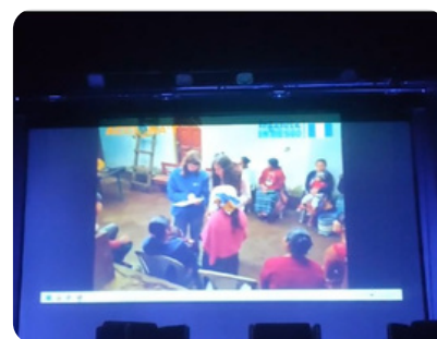
En streaming, la Blanca i la Magalena, infermeres de la UdG al Projecte Chajinel.