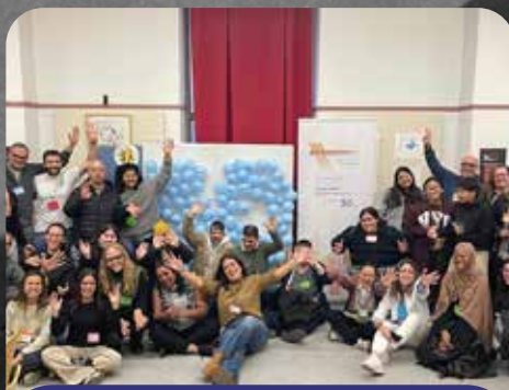
Jornada Anual - Participació en la Governança