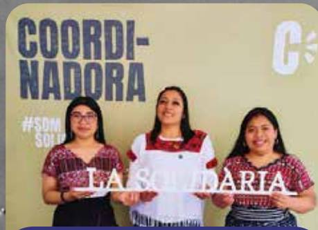
La Solidària - Coordinadora d'ONGs