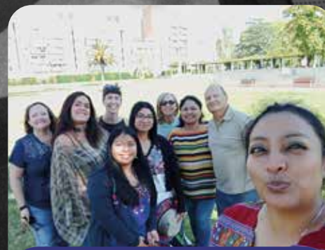
18 persones voluntàries acompanyen el Chajinel