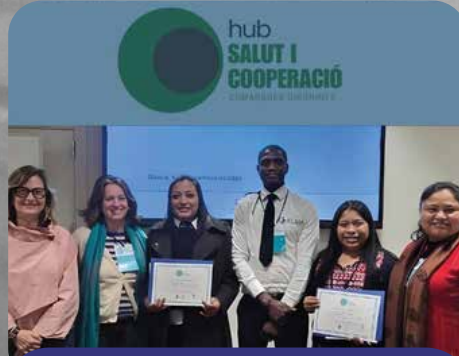
HUB Salut i Cooperació Comarques Gironines