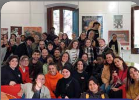
Fira de Voluntariat Local - Ajuntament de Girona