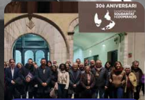
30è Aniversari - Consell Municipal Solidaritat i Coop.