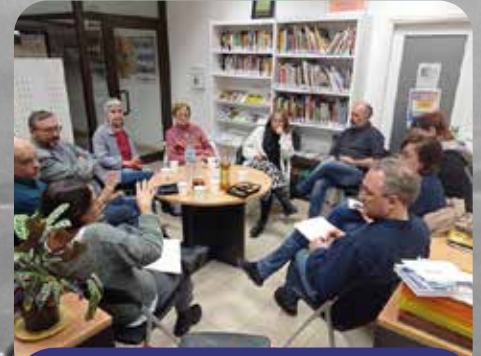
Consell Municipal de Cooperació de l'Aj. de Girona