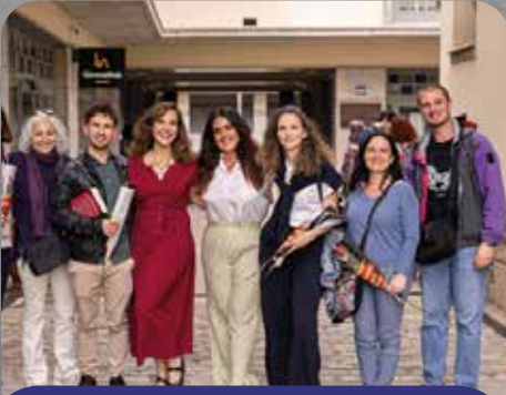
Premis Acció Social - Plataforma Educativa